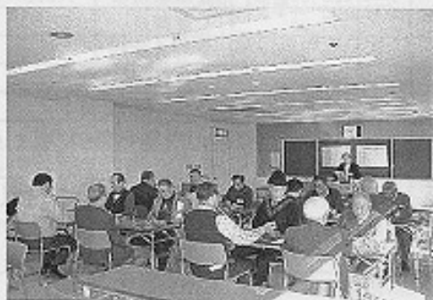
2月28日碁会