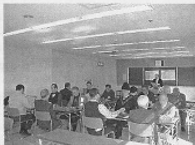
2 月 28 日の碁会